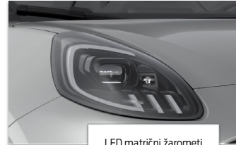
LED matični žarometi