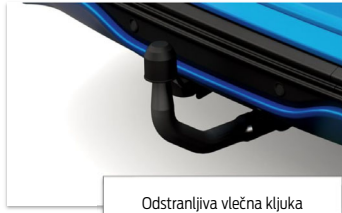
Odstranljiva vlečna kljuka